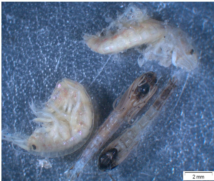
Maaginhoud van vlokreeft en muggenpoppen.

Daarom houdt mijn collega niet zo van vissen, ze eten alles op waar hij zijn brood mee verdient. Half maart heb ik, dit keer met zelfgemaakte buzzers ook heel best gevangen. Nu weer drie vissen meegenomen en gekeken. De vissen zaten nu vol met muggenpoppen, vlokreeften en slakken.