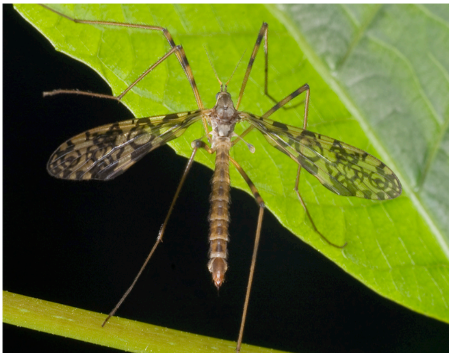
Epiphragma ocellaris , een langpootmugje van 5-10 mm groot die in de winter actief is.

Omdat de larven van al deze soorten niet in het water leven, en er op mooie winterdagen hooguit volwassen individuen in het water waaien, zijn het dus niet echt soorten die hoog op de menukaart staan voor vissen.