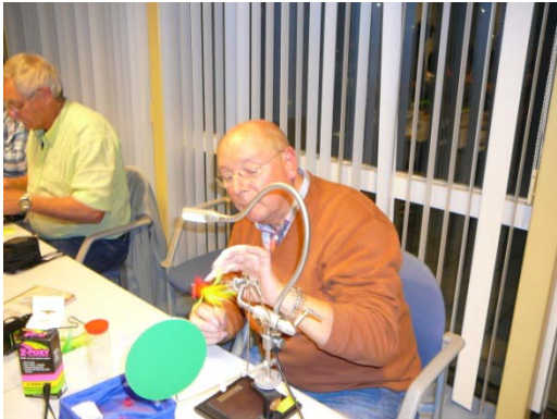
De gevorderden bij het binden van snoekstreamers.