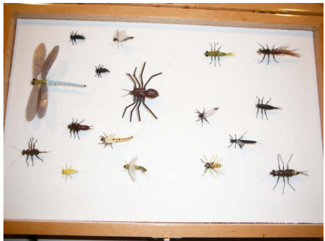
Thomas Snel met zijn verzameling